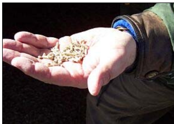
På Bosarp serveras mättande smalmat som är anpassat till kycklingarnas långa uppfödningstid.

Birgitta tycker att flyttbara uppfödningssystem ger friskare individer. Mellan varje kull flyttas husen något 10-tal meter för att minska risken för eventuell smittspridning.