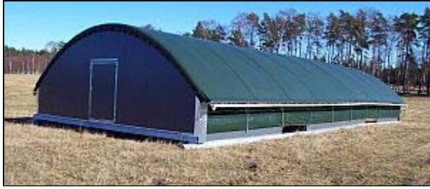
De flyttbara husen har medar undertill och kan därför släpas med hjälp av en traktor.

– Vi har precis köpt nya flyttbara hus från Frankrike, berättar Claes. Totalt har Birgitta och Claes köpt in sex hus och grävt ned en stamledning för el och vatten. Investeringen har gått på ca 1,6 miljoner kronor, men medger att produktionen kan utökas till nära 50 000 slaktkycklingar per år.