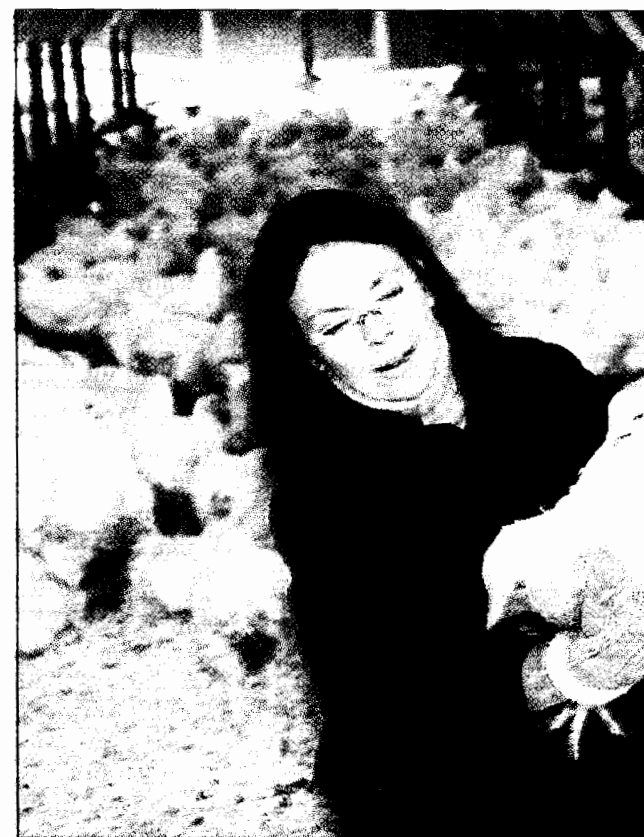
Bosarpskycklingen hinna växa till sig rejält, slaktvikten ligg...